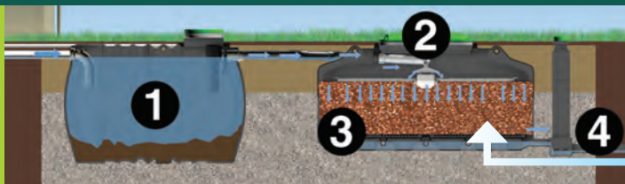
(1) Fossa com Pré Filtro (2) Filtro Compacto de Coco Premier Tech (3) Meio filtrante (fragmento de casca de Coco) (4) Saída de efluente tratado